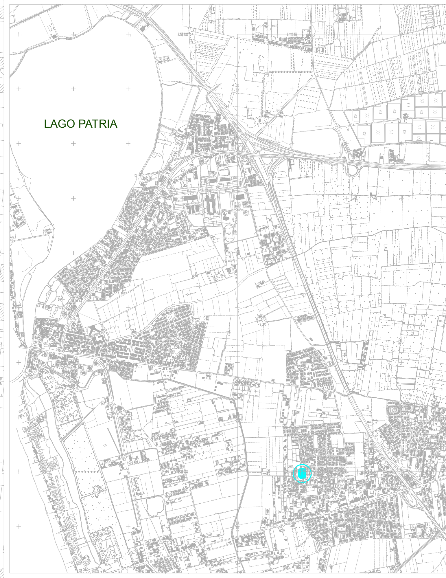
PLANIMETRIA AEREOFOTOGRAMMETRICA rapp. 1: 20.000